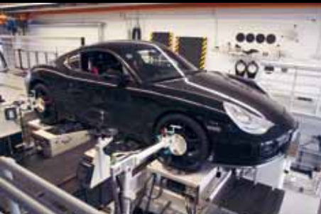
Messtechnik zur Fahrwerk-Erprobung.