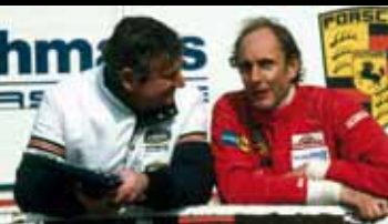
Damals wie heute ist der geniale Konstrukteur ein wichtiger Berater im Rennsport.