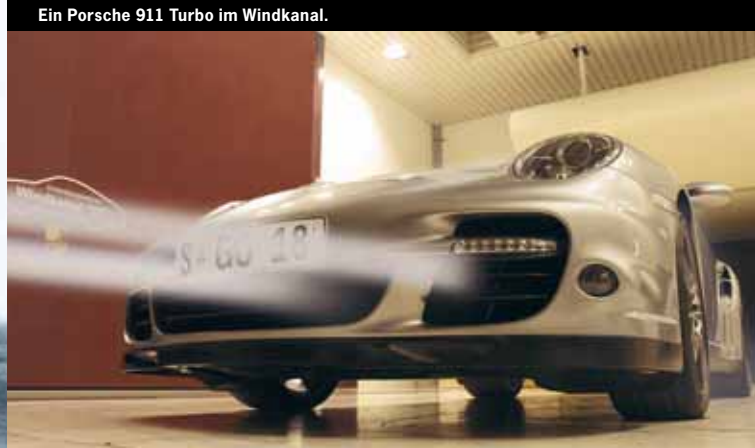
Ein Porsche 911 Turbo im Windkanal.