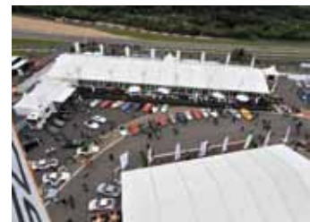
Alle Bilder wurden auf dem Porsche Classic Gelände aufgenommen.