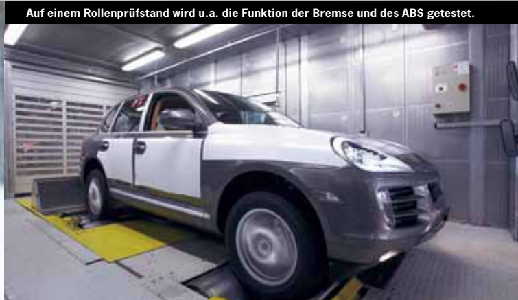
Auf einem Rollenprüfstand wird u. a. die Funktion der Bremse und des ABS getestet.