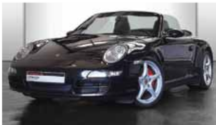
10 Porsche 911 Carrera 4S Cabriolet Schwarz EZ 05/2008 | 42.662 km | EUR 67.900