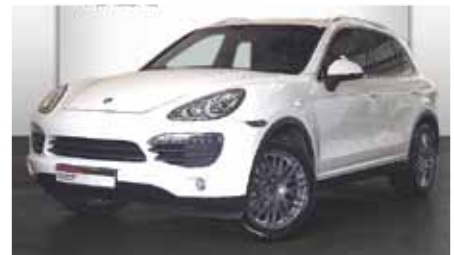
12 Porsche Cayenne S Sandweiß EZ 09/2010 | 14.175 km | EUR 79.890