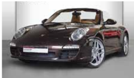
5 Porsche 911 Carrera Cabriolet Macadamiametallic EZ 07/2008 | 35.069 km | EUR 73.900