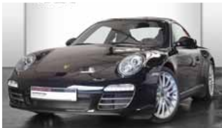
7 Porsche 911 Carrera 4S Schwarz EZ 02/2010 | 70.786 km | EUR 73.880