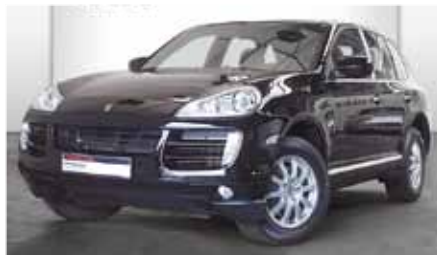
11 Porsche Cayenne Diesel Schwarz EZ 09/2012 | 57.335 km | EUR 51.880