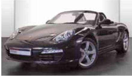
1 Porsche Boxster Basaltschwarzmetallic EZ 06/2011 | 7.159 km | EUR 42.880

So einfach kann Porsche Fahren sein: anschauen, einsteigen, losfahren. Unter unseren Gebrauchten finden Sie garantiert den Richtigen für Sie. Kommen Sie einfach einmal vorbei. Wir beraten Sie gerne.