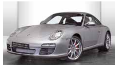
9 Porsche 911 Carrera 4S GT-silbermetallic EZ 06/2011 | 10.458 km | EUR 93.330