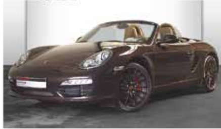
2 Porsche Boxster S Macadamiametallic EZ 02/2010 | 17.045 km | EUR 48.890