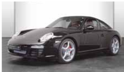
8 Porsche 911 Carrera 4S Schwarz EZ 10/2009 | 17.443 km | EUR 89.440