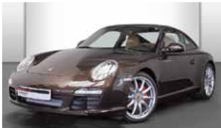
4 Porsche 911 Carrera S Macadamiametallic EZ 04/2011 | 12.073 | EUR 84.550