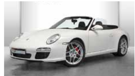
6 Porsche 911 Carrera S Cabriolet Cremeweiß EZ 04/2009 | 33.160 km | EUR 73.810