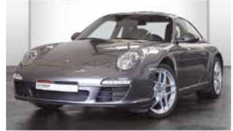
3 Porsche 911 Carrera Meteorraumetallic EZ 01/2011 | 14.900 km | EUR 73.900